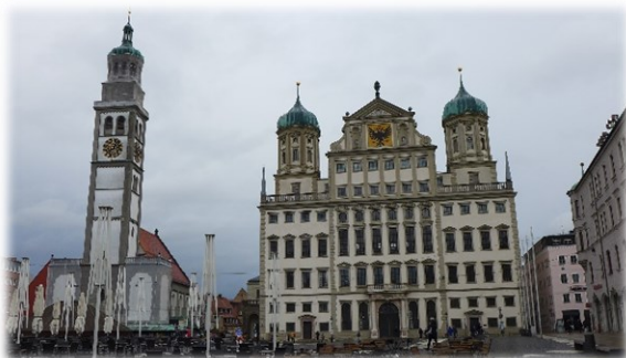
Historisches Rathaus Augsburg

Nach ca. 2 Stunden dann Rückfahrt zum Hotel nach Pöttmes.