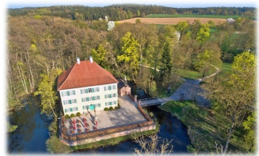
Sisi Schloss Unterwittelsbach

Die Alternativgruppe fährt nach kurzem Rundumblick zum „Sisi Schloss Unterwittelsbach“ und hat dort ca. 1,5 Stunden Aufenthalt. Um 11.45 Uhr Abfahrt nach Hörzhausen zum Treffpunkt mit der Wandergruppe. Danach weiter nach Schrobenhausen, mit längerem Aufenthalt in der gemütlichen Altstadt.