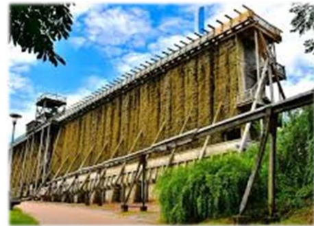
Gradierwerk Bad Kösen

Wir hoffen, dass die Informationen das Interesse für die 4-Tage-Tour geweckt haben und würden uns über zahlreiche Beteiligung sehr freuen. Es werden hoffentlich wieder sehr schöne, abwechslungsreiche Tage in lustiger Gemeinschaft, bei hoffentlich gutem Wetter und wenigen Einschränkungen.